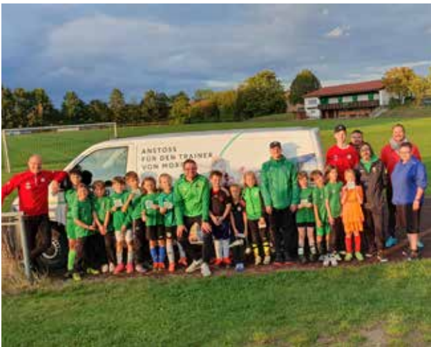
Besuch des DFB-Mobils und Training mit rund 15 Kindern am 24.09.2024