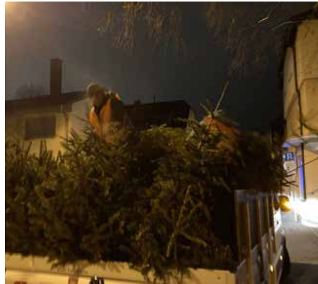
Die ehrenamtlichen Helfer des CVJM wurden von der THW- und Feuerwehrjugend an diesem Tag tatkräftig unterstützt