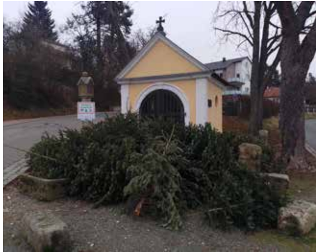
Ein Rekordergebnis bei der CVJM-Christbaumaktion 2025! Fast 12.000 € kamen bei der Sammelaktion zusammen