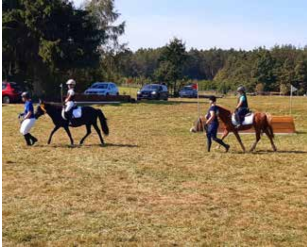
Eindrücke von unserem Reitturnier