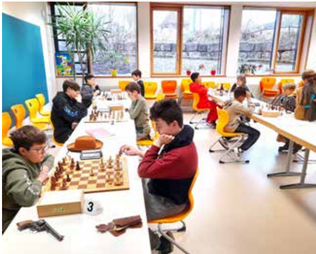
Faschingsblitzturnier mit Verkleidung