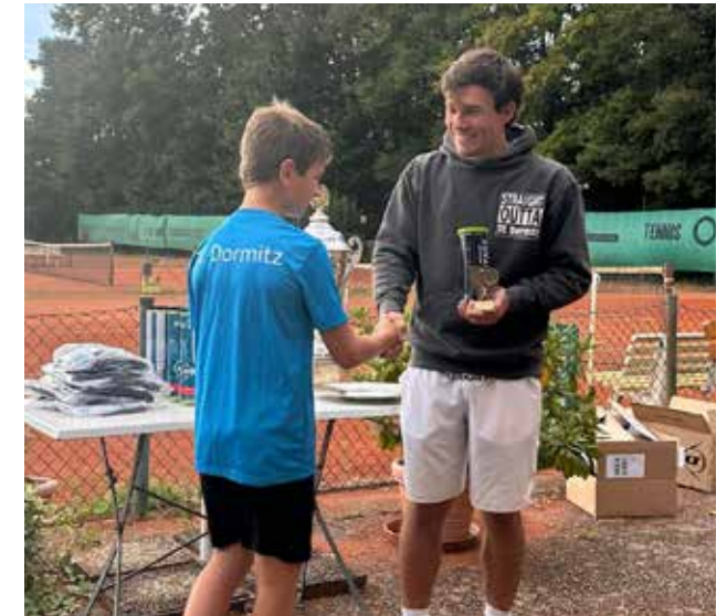
Siegerehrung der Vereinsmeister beim Schleifchenturnier