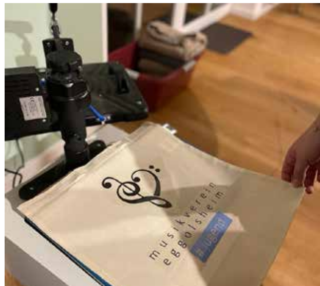
In diesem Jahr haben wir etwas ganz Besonderes für unser Jugendorchester: selbstgemachte, personalisierte Taschen als Weihnachtsgeschenk