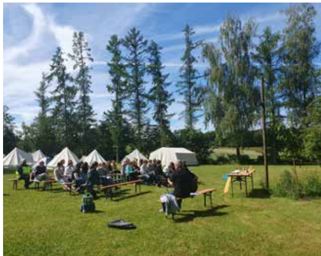
Abschlussgodi beim Konficamp