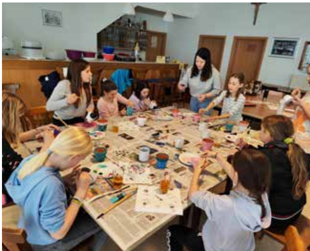
Mit viel Freude bemalten die jungen Musikerinnen Blumentöpfe in bunten Farben und bepflanzen sie anschließend mit Frühlingsblumen