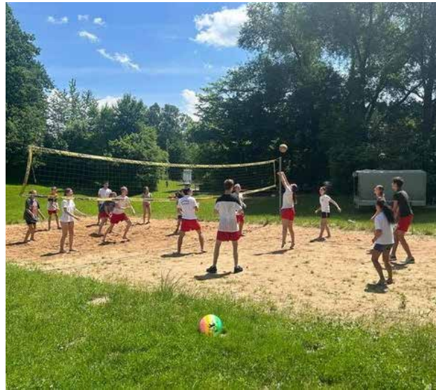
Volleyball beim Jugendzeltlager