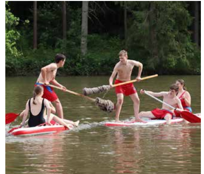
Fischerstechen am Jugendzeltlager