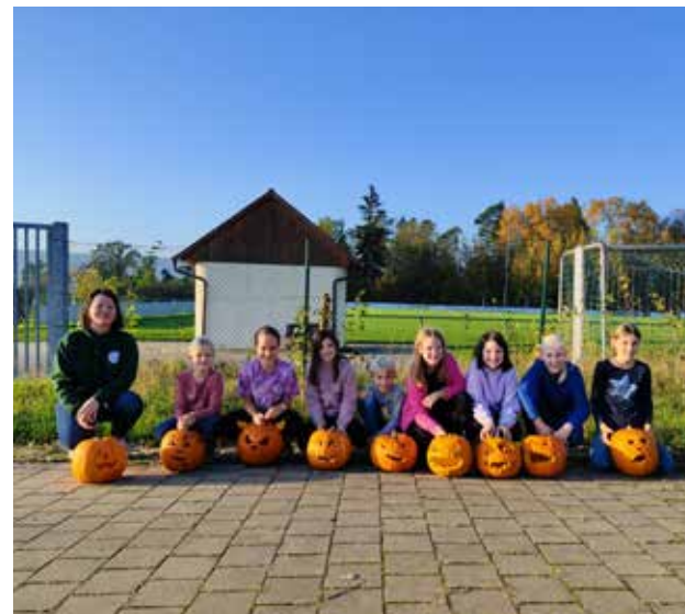
Beim Kürbisschnitzen entstand mit viel Spaß und Kreativität eine stimmungsvolle Atmosphäre, die perfekt zur Halloweenzeit passte