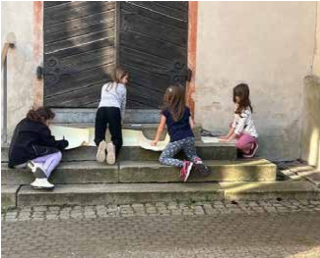
Da die Kinder gerne malen und basteln, haben wir das schöne Wetter genutzt und die Aktivität nach draußen gelegt