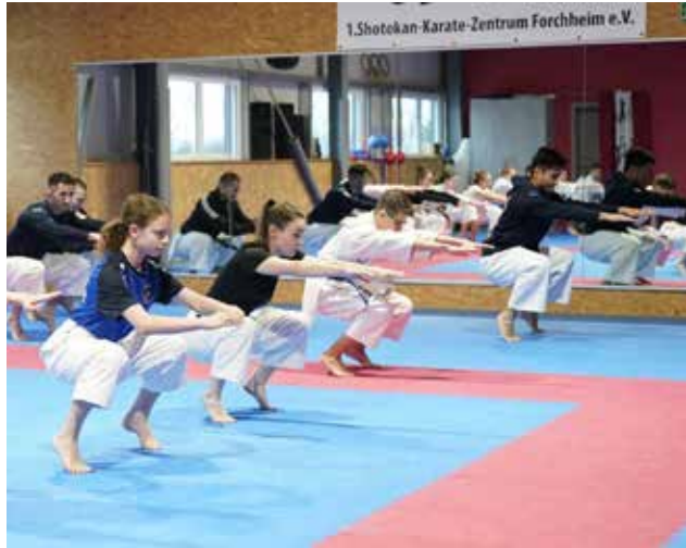
Impressionen aus den Trainingseinheiten ...