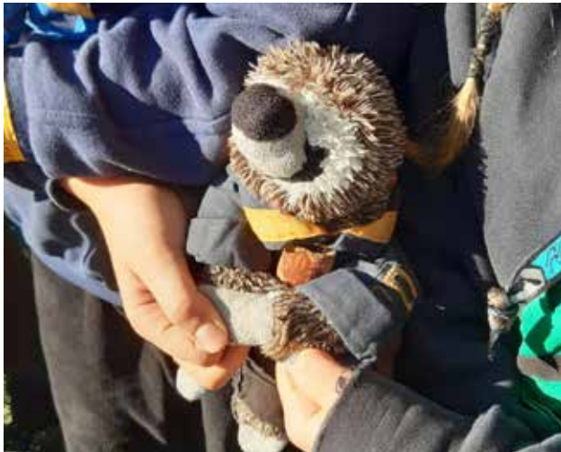
Der Abschlusskreis vom Lauterburglauf ist immer ein Highlight