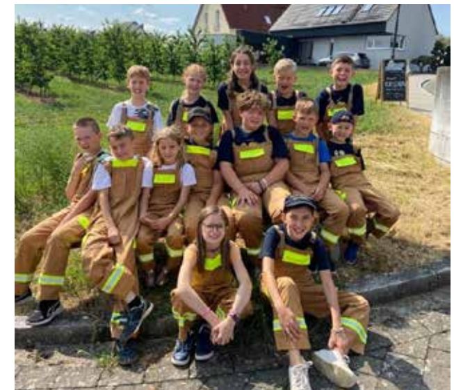
Unsere Bambinis meisterten die Olympiade der Feuerwehr-Nachwuchskräfte mit Teamgeist und Begeisterung