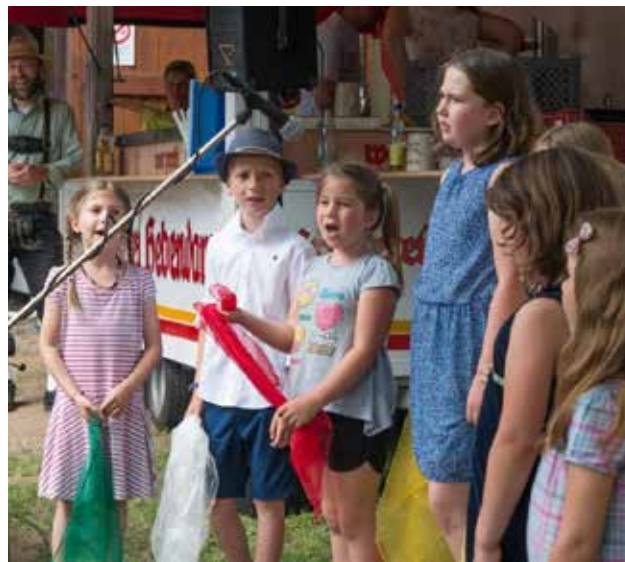
Bei einem Auftritt an unserem Grillfest zeigten die Kinder ihre Sangesfreude und verbreiteten Freude unter den Gästen