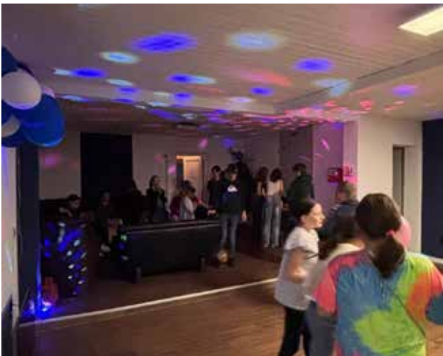
Im September gab es eine Party für unser Jugendorchester. Mit toller Musik und viel Gelegenheit zum Tanzen hatten die Jugendlichen großen Spaß