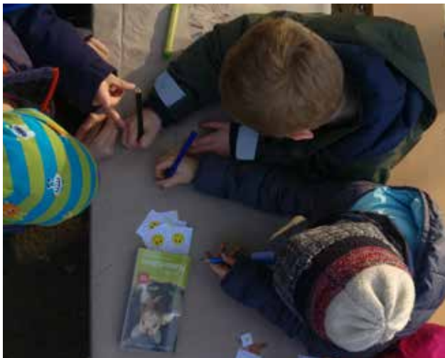
Wir suchen einen tollen Gruppennamen. Nach einem kreativen Brainstorming und demokratischer Abstimmung sind „Die Forchheimer Fische“ geboren!