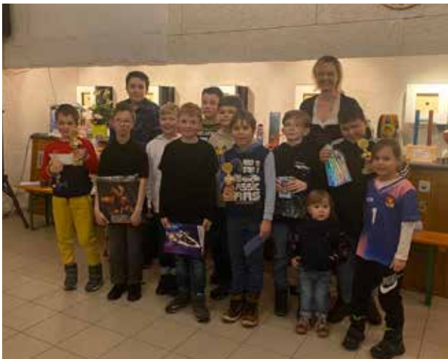
Ein riesiger Spaß war unserer traditioneller Königsball