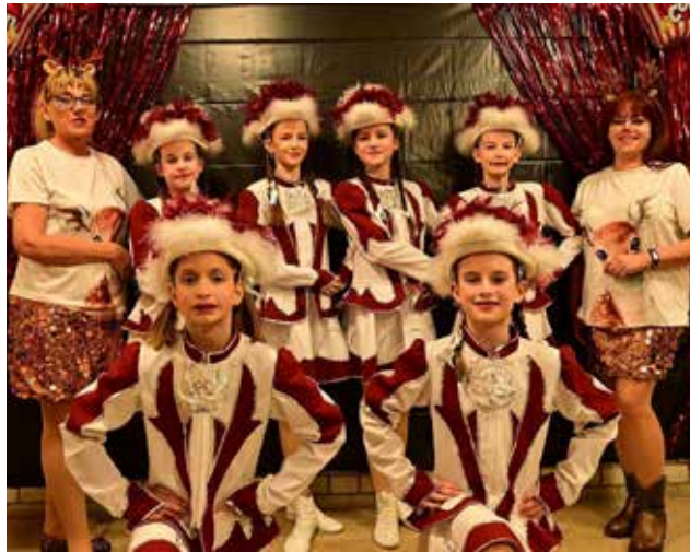
Garde beim diesjährigen Faschingsball am 14.02.25