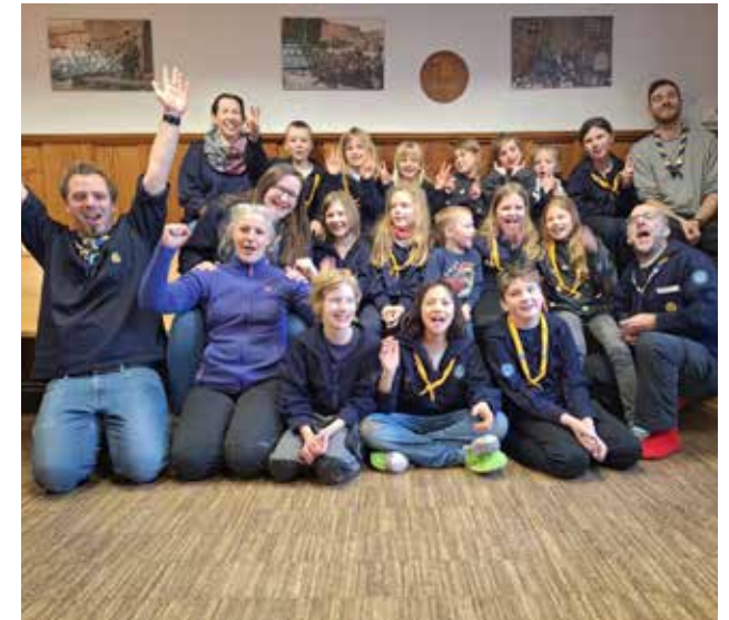
Im Winterlager waren die Kinder auf den Spuren der Tiere im Schnee unterwegs