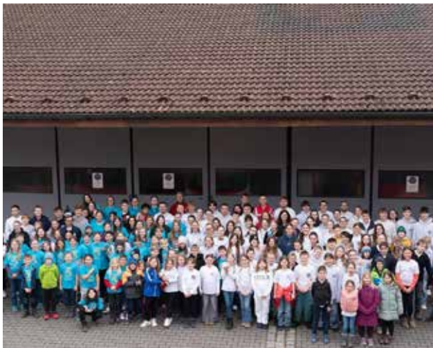
Gruppenbild aller Mannschaften und Betreuer am Kreiswettbewerb