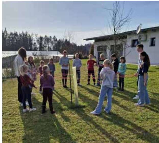
In diesem Jahr wurde beim Kinonachmittag noch eine Teambuildingeinheit mit den einzelnen Gruppen durchgeführt