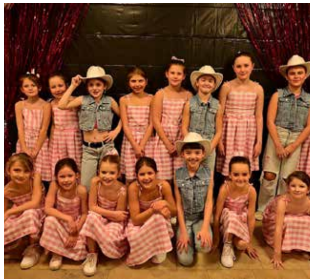
Kindertanzgruppe beim diesjährigen Faschingsball am 14.02.25