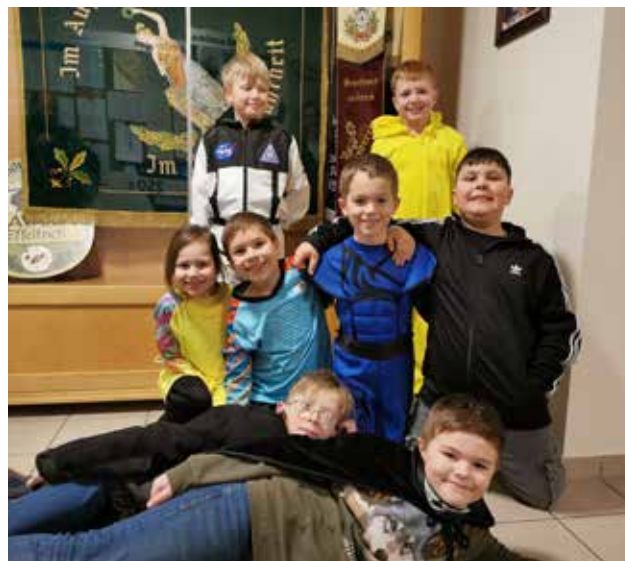
Bei unserem Faschingstraining ...