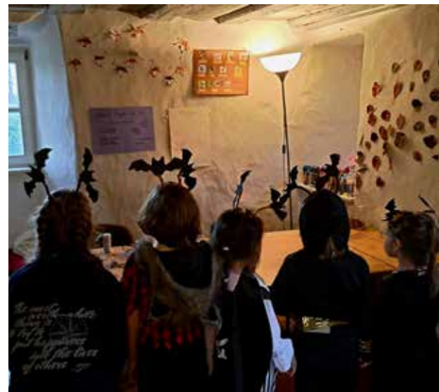
In unserer Halloweengruppenstunde haben wir richtig coole Fledermaushaarreifen gebastelt, das hat Spaß gemacht