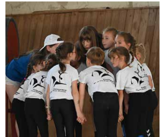
Für die Breitensportgruppen veranstaltete die VuPSG Poxdorf einen Breitensporttag mit zahlreichen Teilnehmern