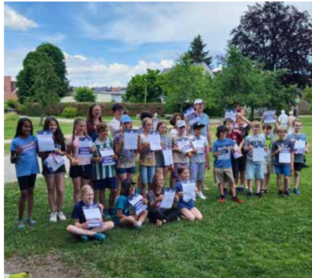
Für die Bläserklasse gab es nach bestandem Juniorprüferabzeichen die Urkundenverleihung mit unserem Bürgermeister