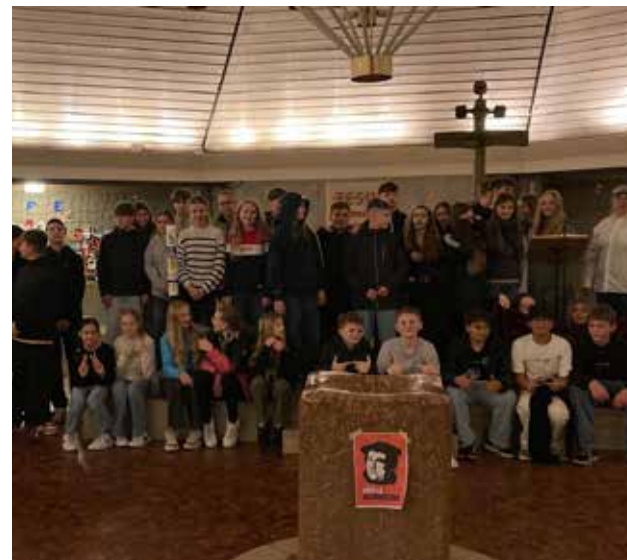
Pizza und Kino in der Kirche waren Abschluss eines Geländespiels, bei dem die Jugendlichen gemeinsam entdeckten, was Reformation heute heißen kann