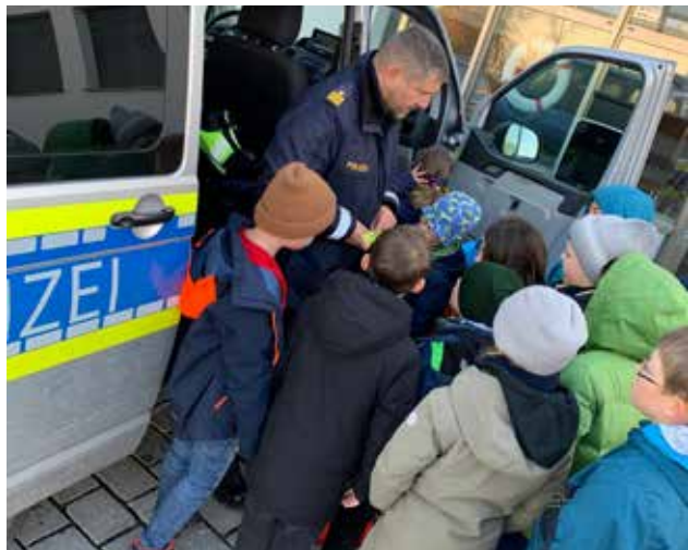
Ein großes Highlight war im November der Besuch bei der Wasserschutzpolizei