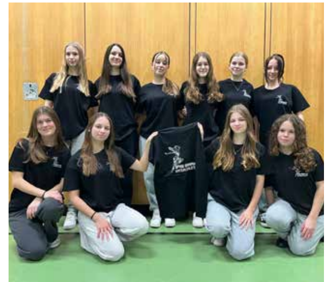
Young Generation und in der Turnhalle Unterleinleiter mit neuen T-Shirts