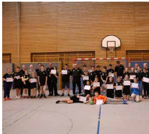
... und das Motto „Spielerlebnis ist wichtiger als Spielergebnis“ im Vordergrund