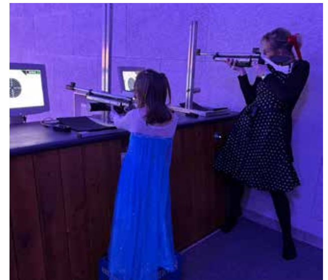
... wurde in der neuen Disziplin „Lichtpunktgewehr“ geübt