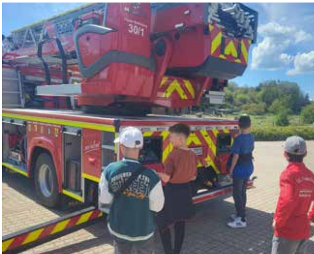
Besuch der Kinderfeuerwehr Obertrubach bei der Besichtigung der Drehleiter