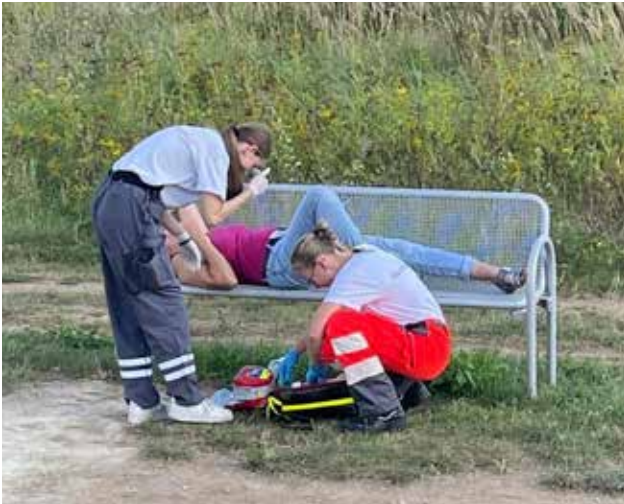
In einem Übungsszenario mussten verletzte Personen versorgt und für den Transport ins Krankenhaus vorbereitet werden