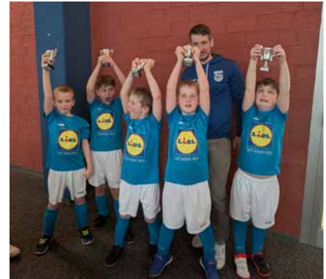
Glückliche Gesichter der Jugendmannschaft beim Abschluss des Hallenturniers