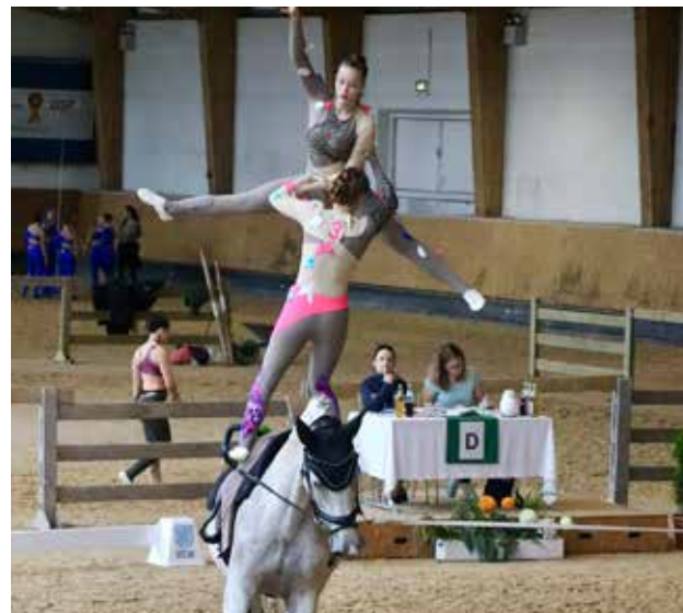
Die 1. Mannschaft des VuPSG Poxdorf qualifizierte sich für die Bayerischen Meisterschaften 2024 und zeigt einen sauberen Kürdurchlauf