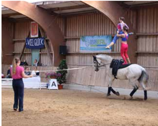
Die Doppel-Voltigierinnen des VuPSG Poxdorf auf der Fränkischen Meisterschaft 2024