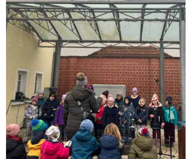
Am 01.12.24 hatten wir einen Auftritt beim Adventsopening in Heroldsbach und stimmten die Zuhörer auf die Vorweihnachtszeit ein