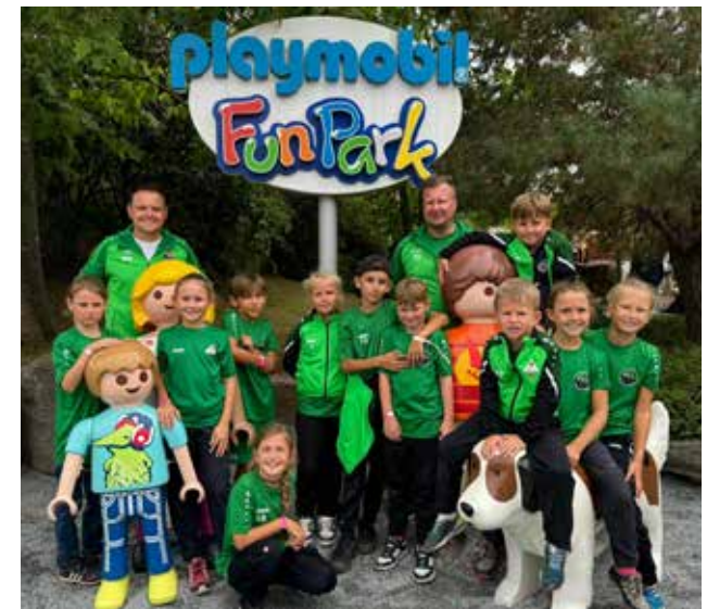
Ausflug der E-Jugend-Fußballmannschaft am 09.09.2024 in den Playmobil FunPark