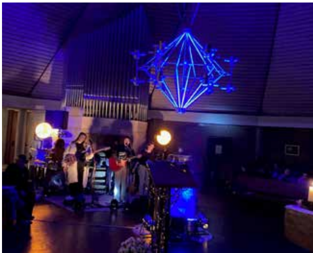
Für Feieratmosphäre sorgte die Band „Peacemaker“ mit aufwendigen Lichteffekten und toller Musik