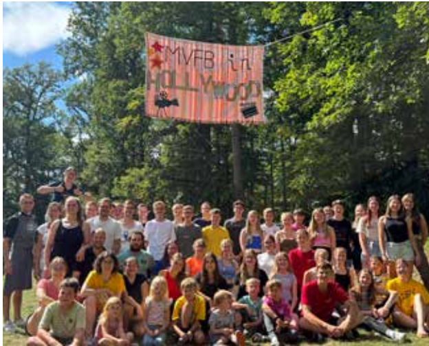
Im August ging es für uns ins jährliche Zeltlager. Mit ca. 55 jungen Musiker*innen erlebten wir sechs Tage voller Spaß, Spiele und Gemeinschaft