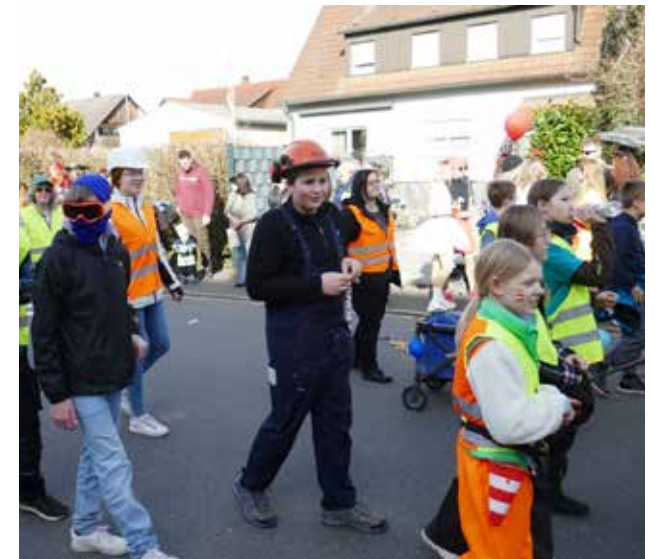
Im März verteilten beim Faschingsumzug unsere jüngeren Orchester Süßigkeiten an die Zuschauer