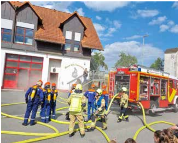
Jugendliche zeigten beim Sommerfest in einer realistischen Schauübung ihr Können und Engagement