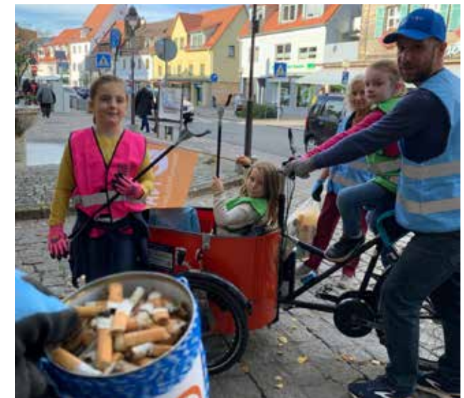
So viel Müll in der Stadt, das ist ganz schön viel Arbeit! Zum Glück konnten wir die letzten Meter mit unserem tollen Müllmobil fahren.