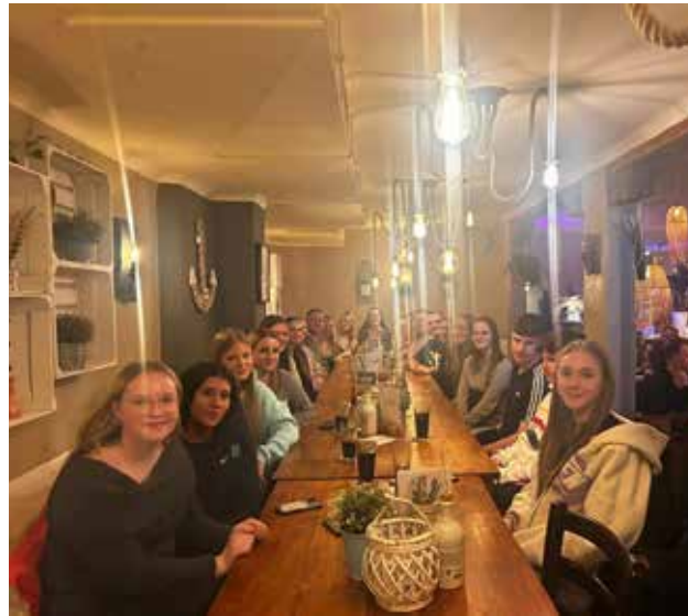
Unsere beiden älteren Gruppen trafen sich am 27.12.24 zum Bowling im Sportland Erlangen und ließen den Abend im Galileo ausklingen