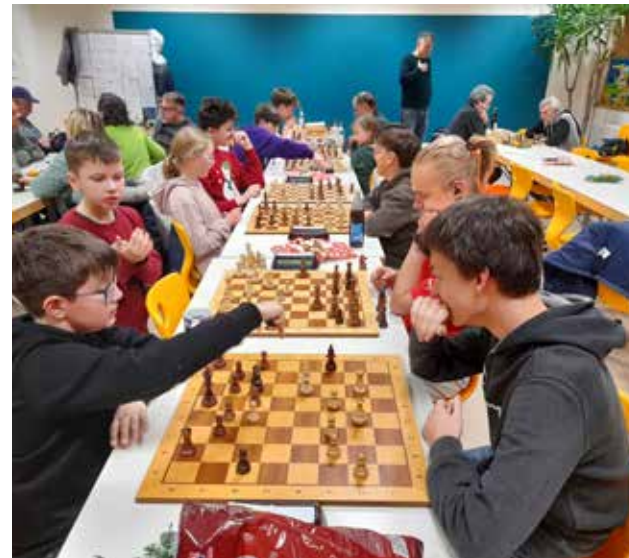
Weihnachtsfeier 2024 mit einem Tandemblitzturnier