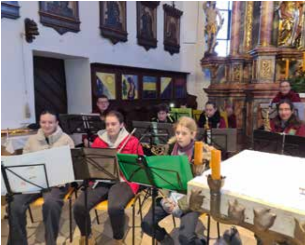
Weihnachtskonzert 2024 in der Pfarrkirche Effeltrich