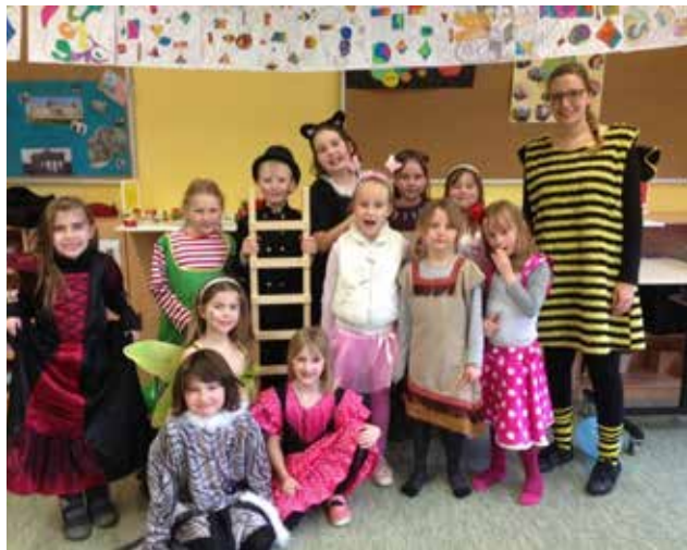
Gemeinsam feierten die Kinder eine Faschingsprobe. Alle kamen verkleidet, spielten Spiele, tanzten und lachten