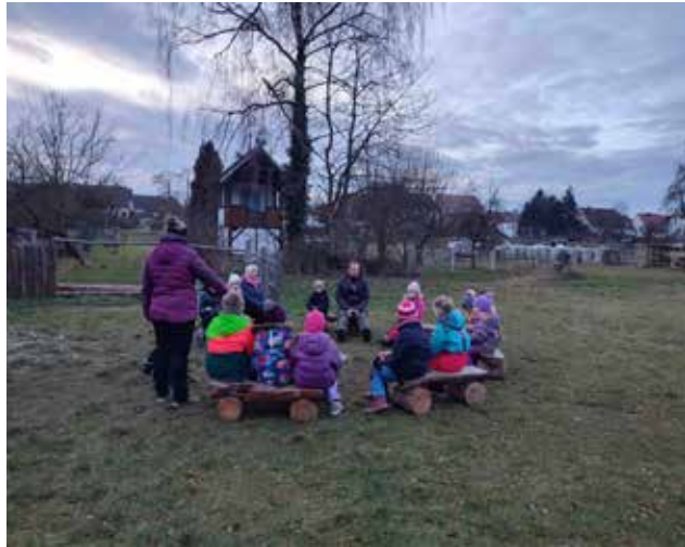
Einblick in unsere Meutenstunde