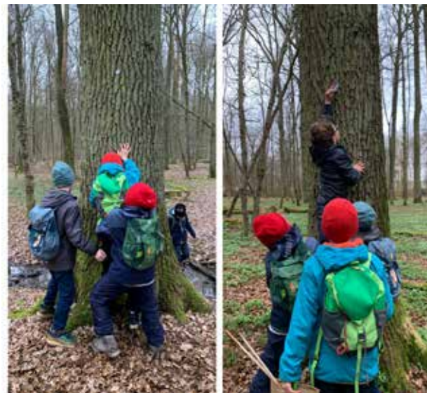
Bei unserer Schnitzeljagd sind Grips und Teamgeist gefragt! Na klar, bei Räuberleiter muss der Kleinste ganz nach oben!