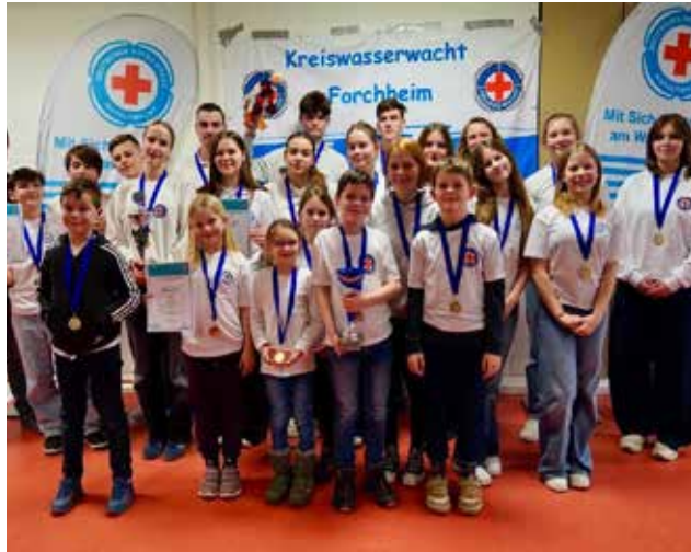
Die Sieger am Kreiswettbewerb