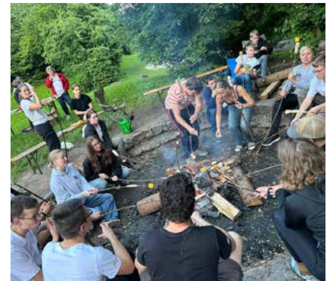
Stockbrot beim Zeltlager der Wasserwacht Ebermannstadt