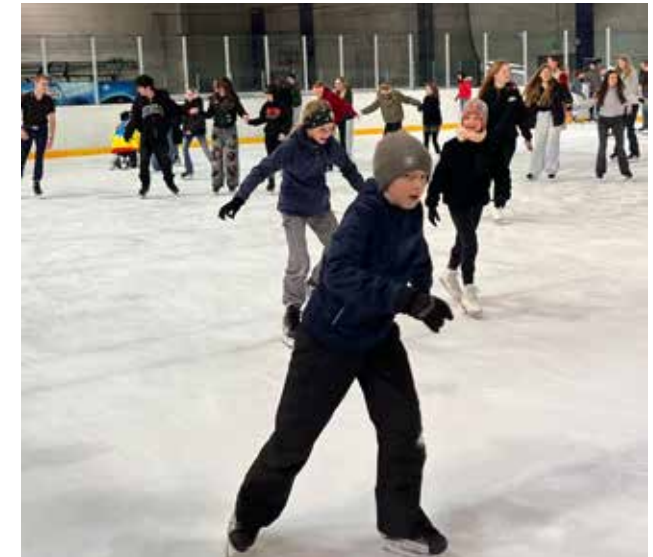
... zum Schlittschuhlaufen in die Eishalle nach Nürnberg