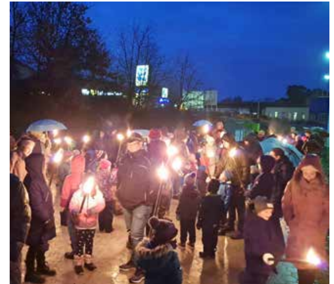
Im Rahmen unserer Weihnachtsfeier veranstalteten wir eine Nachwanderung an der über 50 Kinder und 50 Erwachsene teilnahmen