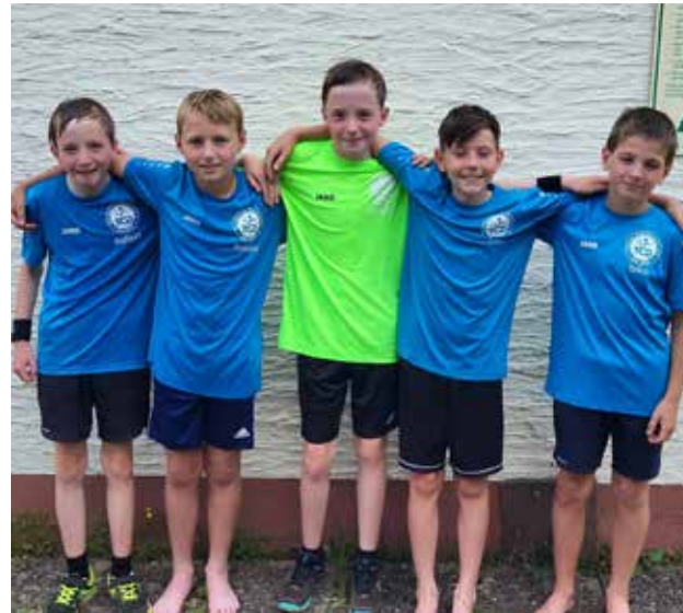
Besonders beeindruckend bei unserer U12/15 Mannschaft ist ihr spielerisches Talent und ihre Fairness