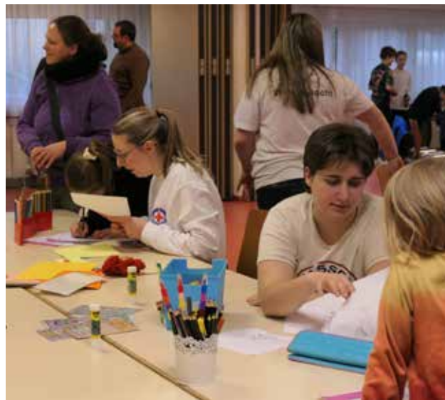
Beim Neujahrsmarkt waren alle Kinder und Jugendlichen mit ihren Familien eingeladen, das Rote Kreuz und die Wasserwacht kennenzulernen