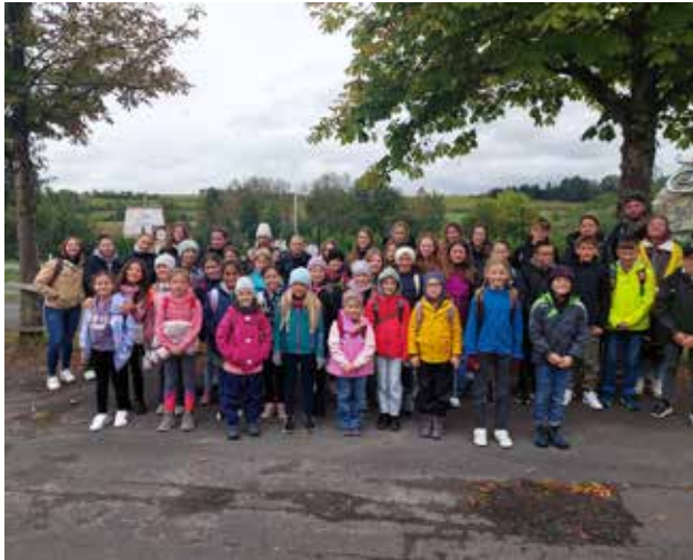
Mit 49 Kindern, 10 Betreuern und bestem Wetter machte sich die NCV-Jugend am 14.09.2024 auf nach Geiselwind