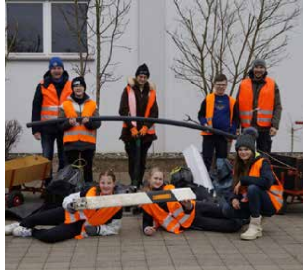
Erstmals fand eine Rama Dama Aktion statt. 136 Kinder- und Jugendliche mit ihren Betreuern sammelten Müll