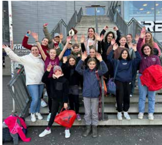
13 Jugendliche und 5 Erwachsene ...