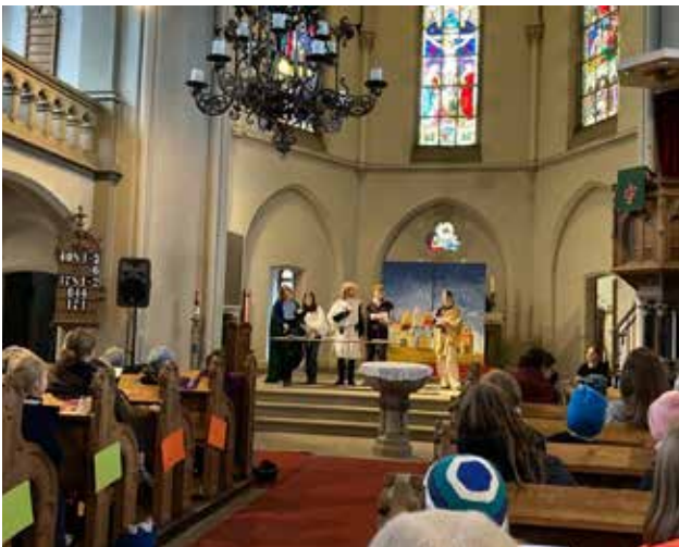
Der Kinderbibeltag stand unter dem Motto „Daniel und sein löwenstarker Freund“, der 80 Kindern einen abwechslungsreichen Tag bot