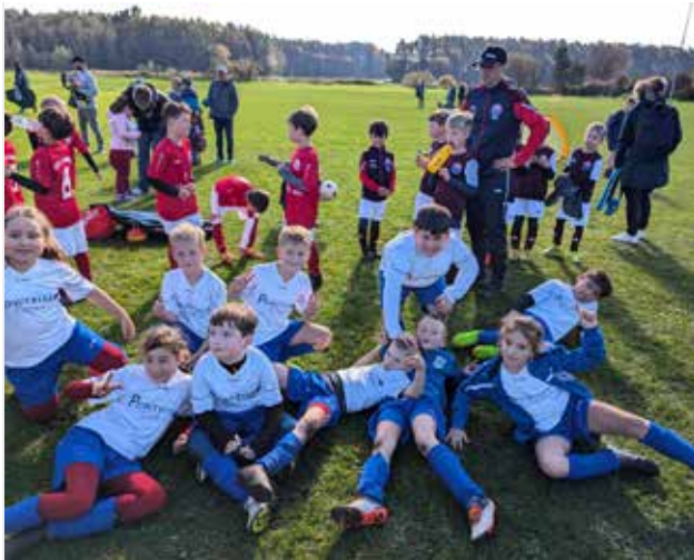
Im Oktober konnte der Verein ein Funinoturnier durchführen, welches durch die tatkräftige Unterstützung der Eltern ein voller Erfolg wurde