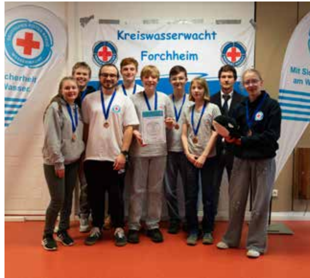
Am 22. Februar fand der Kreiswettbewerb statt, an dem die Jugendgruppe aus Neunkirchen mit sehr großem Erfolg teilgenommen hat