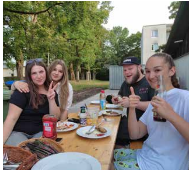
Nach harter Arbeit und vielen Erlebnissen ist es wichtig, sich Ruhe und Entspannung zu gönnen. Das Bild zeigt das gemeinsame Grillen am Abend