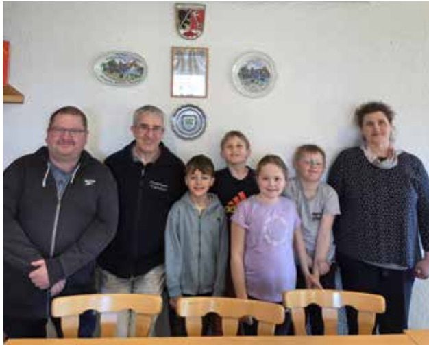
Die Gründungsmitglieder der Kinderfeuerwehr Trailsdorf