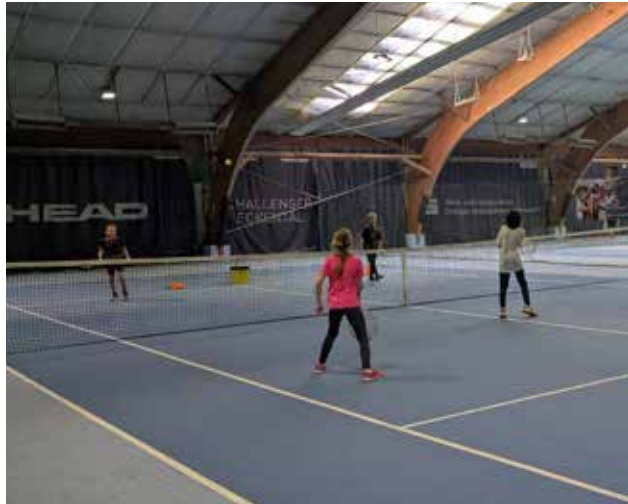
Mit vielen Spielen und Übungen werden die Kinder im Kidtreff ans Tennis spielen herangeführt