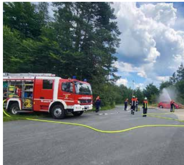
Übung der Jugendfeuerwehr