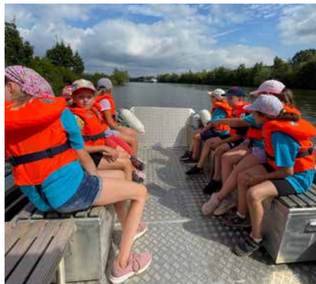
Bootfahren beim Zeltlager der Wasserwacht Forchheim