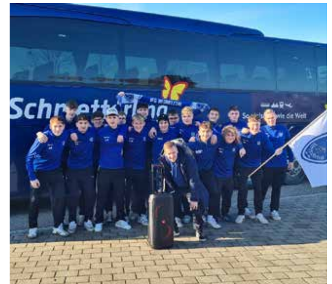
Busfahrt zum Bezirksfinale der Hallenkreismeisterschaften unserer A-Jugend