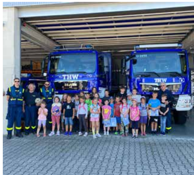
Die Bambinifeuerwehr Weilersbach erlebte beim THW Forchheim spannende Einblicke und viel Spaß