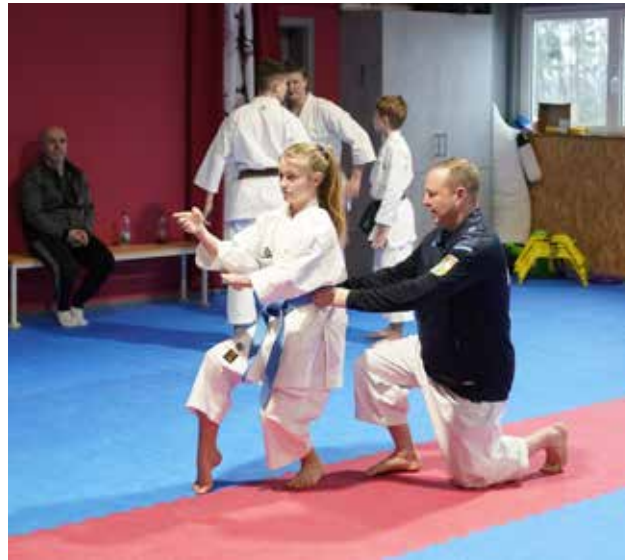
... des 1. Shotokan Karate Zentrums Forchheim