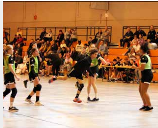
Beim „Spiel des Jahres“ der Integrativen Gruppe und der D-Jugendlichen des HC Forchheim steht der Spaß am Handball ...