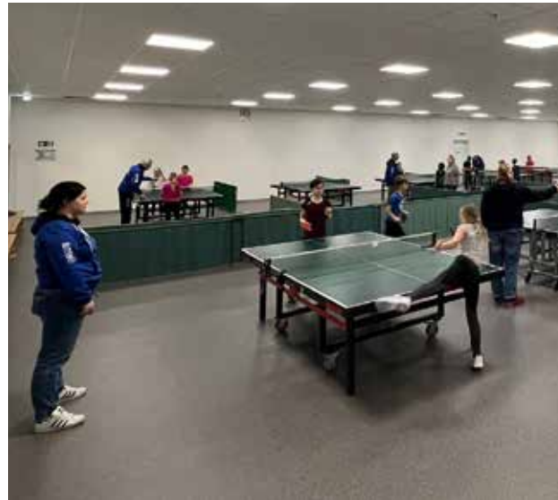
An den TT-Minimeisterschaften nahmen über 25 Kinder teil und konnten so erste Schnuppererfahrungen bei uns im Verein sammeln