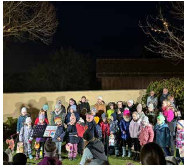
Unser Auftritt beim Laternenumzug am 16.11.24. Danach gab es ein gemütliches Beisammensein mit vielen Leckereien