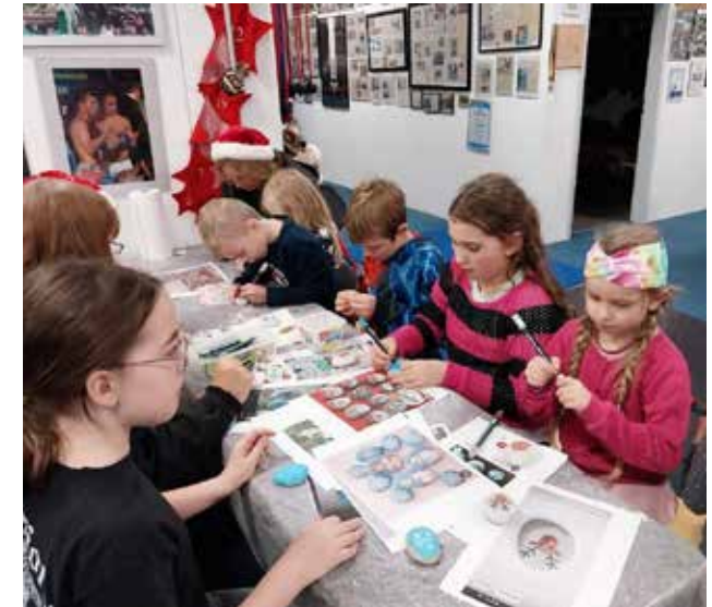
Steine anmalen bei der Weihnachtsfeier 2024