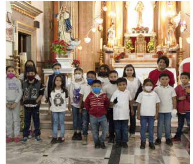
Der Erlös der Sammelaktion ging an Kinder in Mexico, denen damit geholfen werden kann