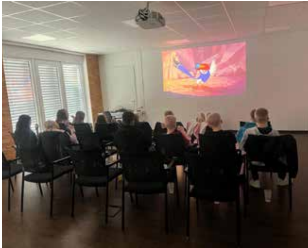
Am 29.03.2025 fand der traditionelle Kinonachmittag der 4 Nachwuchsgruppen statt