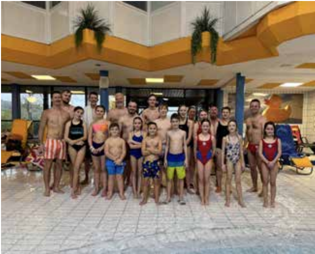
Am 17. November machte sich ein guter Teil unserer Wasserwacht-Jugend auf ins „Atlantis“ nach Herzogenaurach