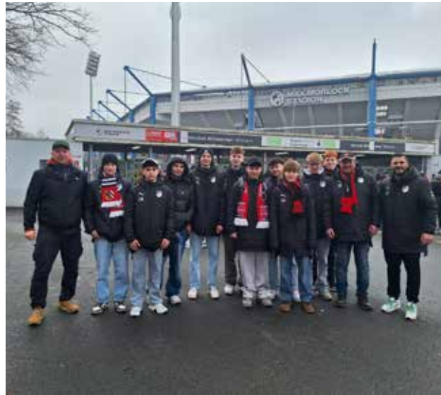
Mit dem Zug fuhren am 01.03. unsere U15 Mannschaft mit ihren Trainern zum Heimspiel des 1. FC Nürnberg und konnten ein tolles Spiel miterleben