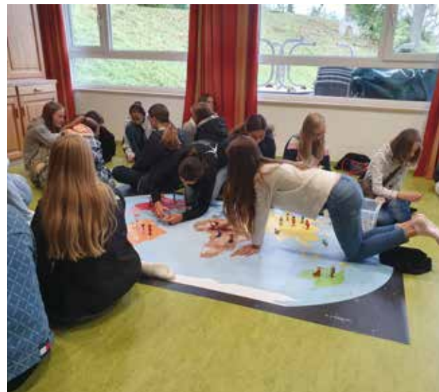
Weltkartenspiel beim Konfifamstag