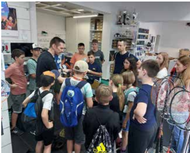
Unser Badminton-Nachwuchs besuchte bei einem Ausflug nach Nürnberg ein Fachgeschäft für Badmintonschläger und hat wertvolle Einblicke erhalten