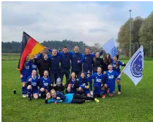
Unsere U15-Juniorinnen wurden Meister in der Herbstrunde 2024