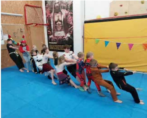
Faschingstraining 2025: Tauziehen bei den Little Dragons