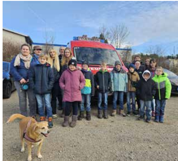
Ausflug der Kinderfeuerwehr Trailsdorf zusammen mit der Kinderfeuerwehr Schlammersdorf am 25.01.25