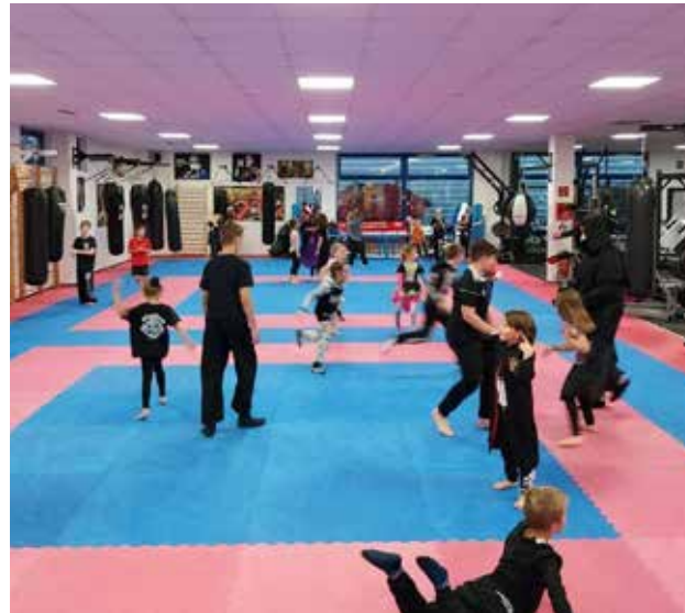
Training bei den Little Dragons an Halloween