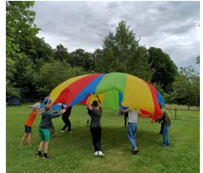
Spiele beim Freizeitwochenende