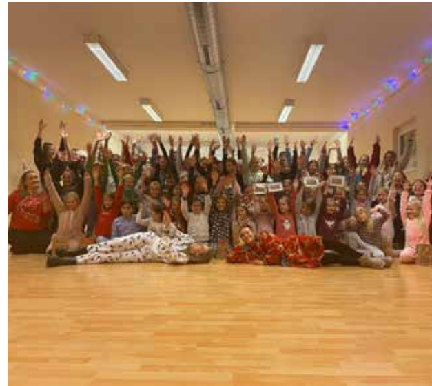
Die Weihnachtsfeier feierte die NCV-Jugend als Schnitzeljagd zum Schützenheim, wo es leckere Pizza und kuschelige Geschenke (Socken) gab