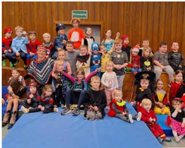
Faschingsfeier der Abteilung „Sport-Spiel-Spaß“ von der DJK SpVgg Effeltrich