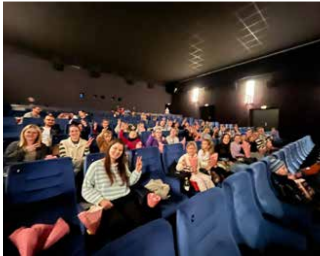
Am 13.12.24 schauten unsere Jüngsten gemeinsam mit der Jugend des FHN den Film Vaiana im Kino Forchheim an, der für strahlende Augen gesorgt hat