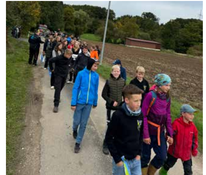
Die gesamte Jugend hat den Kirchweihbaum geholt und am Festplatz aufgestellt