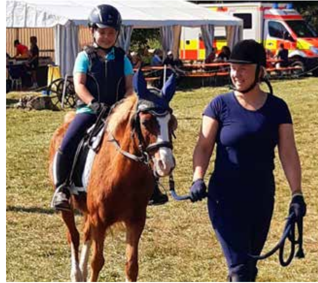
Junge Reiter/-innen können beim Reitturnier ihr Können unter Beweis stellen