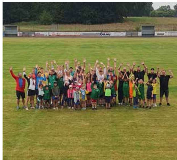
2. SVL Sportcamp am 17./ 18.08.2024 mit ca. 30 Kindern und 7 Sportarten