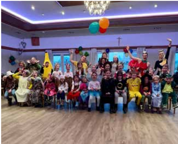
Unsere Faschingssingstunde mit vielen Spielen fand am 25.02.25 in der Gaststätte Dippacher statt