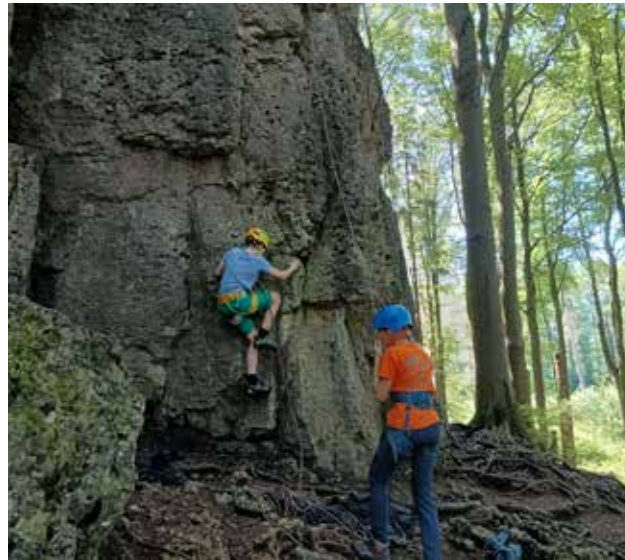
Klettern am Fels