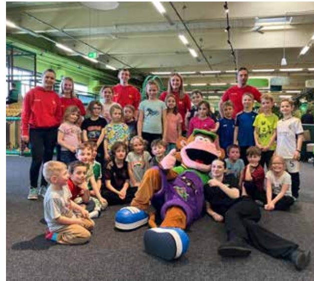
Ausflug in den Indoorspielplatz „Monkey Town“ in Fürth