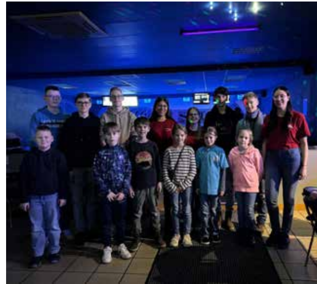
Im Februar fand unsere Jahreshauptversammlung mit anschließendem Bowling statt.