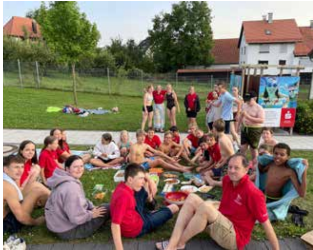
Dieses Jahr fand unsere Abschlussfeier mit anschließendem Picknick unter freiem Himmel in unserem Freibad statt