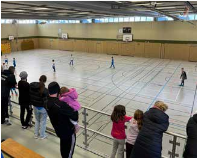
Am 04.12.24 haben wir ein Turnier in der Halle des EGF ausgetragen