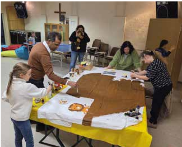
Vorbereitung für den Faschingsumzug 2025