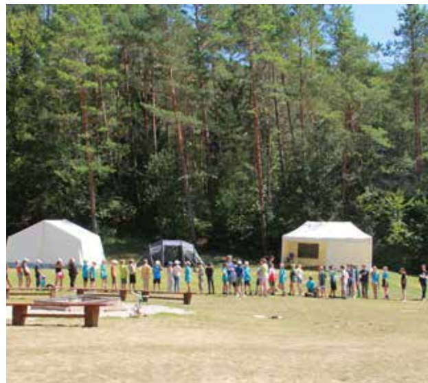
Unser großes Sommercamp unterm Sternenhimmel bietet den Jugendlichen eine unvergessliche Sommerferienwoche in der Natur der Fränkischen Schweiz