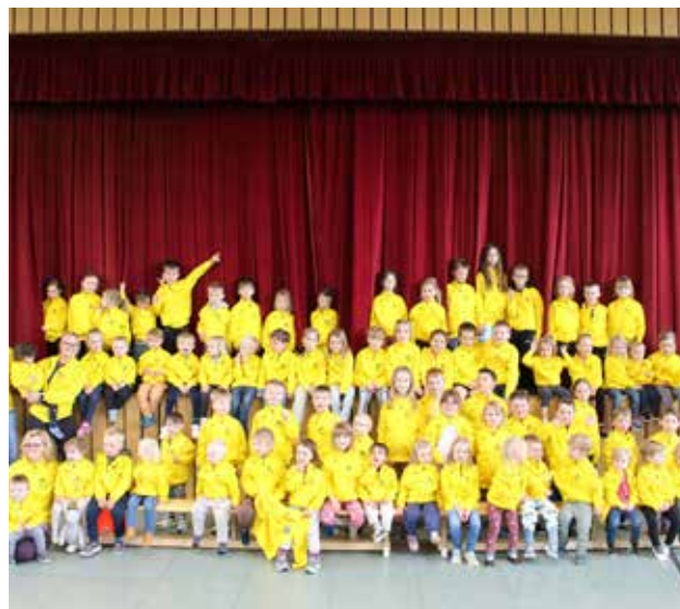
Seit 2005 gibt es bei der DJK SpVgg Effeltrich die Abteilung „Sport-Spiel-Spaß“, die den Kindern unterschiedlichste Bewegungsarten vermittelt