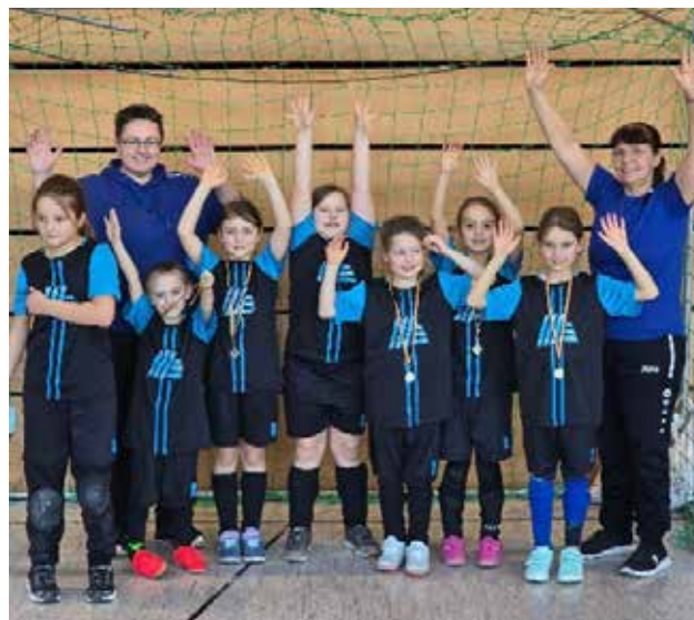
Turniersieger unsere U9-Juniorinnen