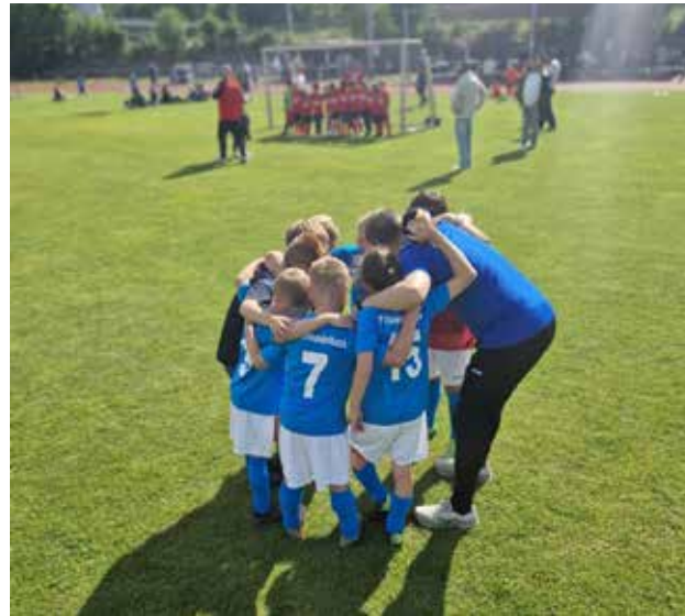
Kurze Besprechung der Mannschaft direkt vor dem Spiel