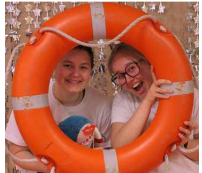
Beim Rettungsschwimmwettbewerb konnten die Kinder- und Jugendlichen unserer Jugendgruppe ihr Können im Wasser und an Land unter Beweis stellen