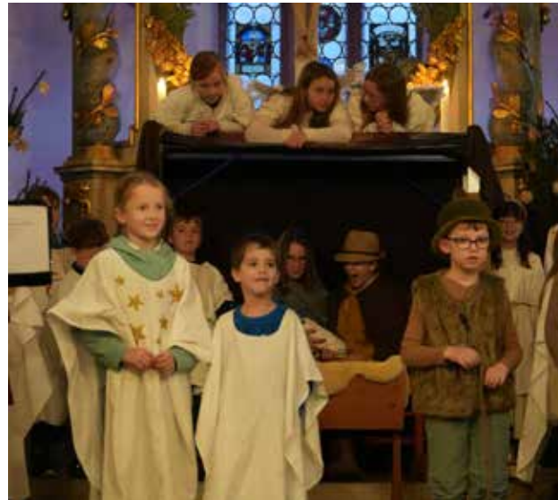
In der Kirchengemeinde Gräfenberg wurde wieder ein Weihnachtsmusical mit 38 Kindern eingeübt