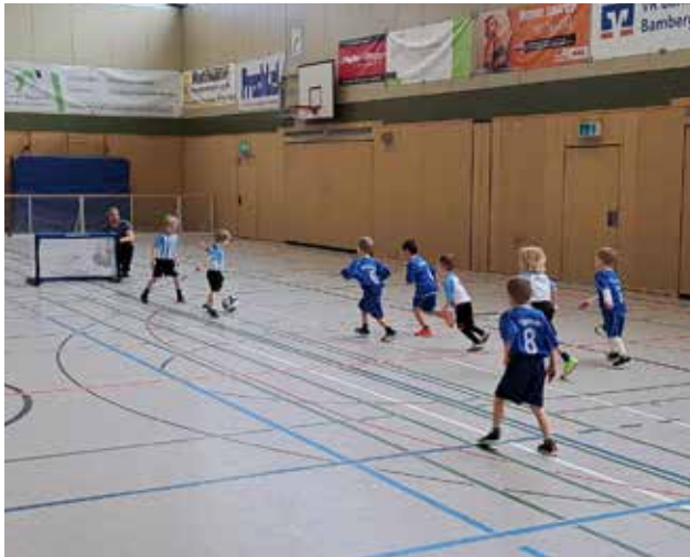
Einlagespiel unserer Bambini-Mannschaft beim Alte-Herren-Turnier in der EGF-Halle vor großem Publikum