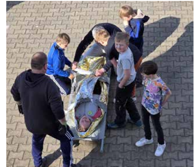
Aus der Gruppenstunde „Rettungsspiel mit der Trage“