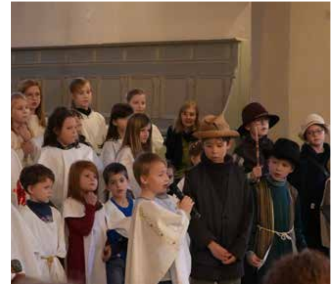
Die Kinder durften Sprechrollen übernehmen und auch solistisch singen