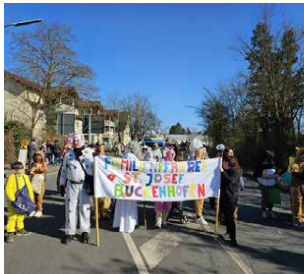
Faschingsumzug in Forchheim 2025