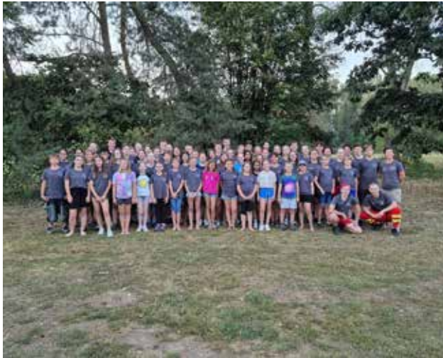
Gruppenbild Gemeinsames „Blaulichtzeltlager“ von DLRG Jugend Forchheim und Wasserwacht Jugend Forchheim